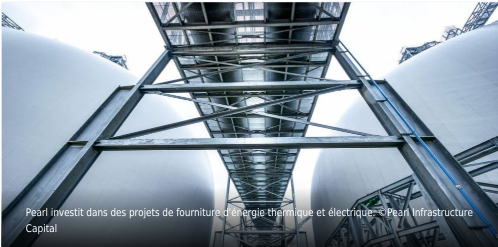
Pearl investit dans des projets de fourniture d'énergie thermique et électrique.

Publié le 21 juil. 2023 à 13:29, mis à jour le 21 juil. 2023 à 15:13